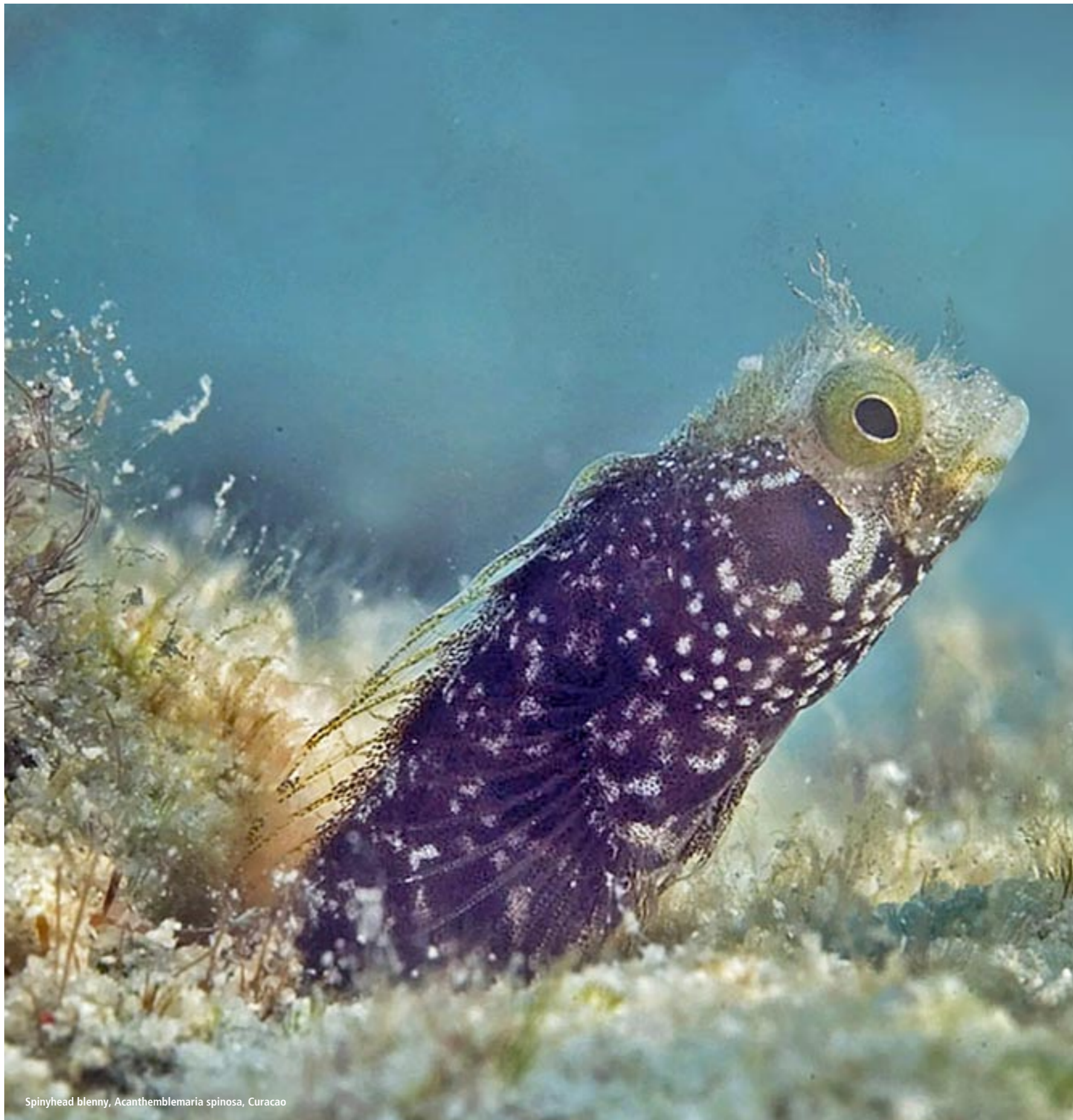
Spinyhead blenny, Acanthemblemaria spinosa , Curacao